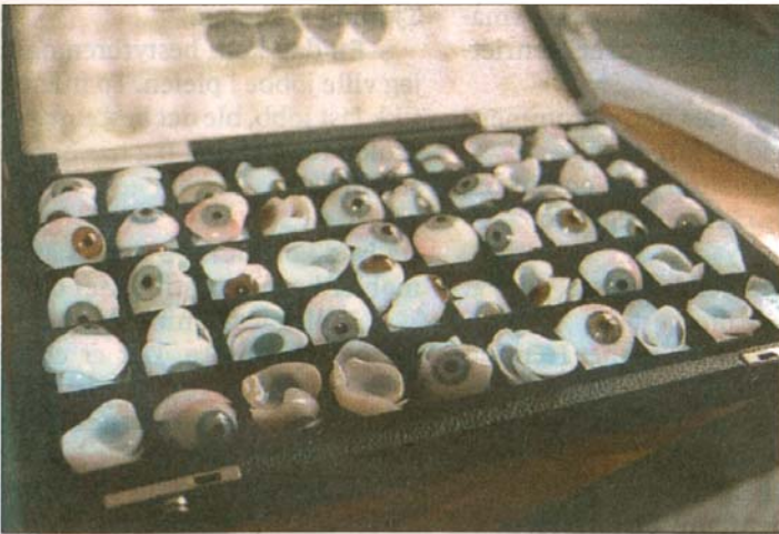
Utvalg: Et utvalg forskjellige proteser spesialdesignet for forskjellige øyehuler.